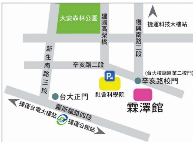
國立台灣大學法律學院霖澤館位置